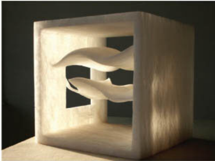
Inner View Offen - peak, Alabaster, 15cmx15cmx15cm